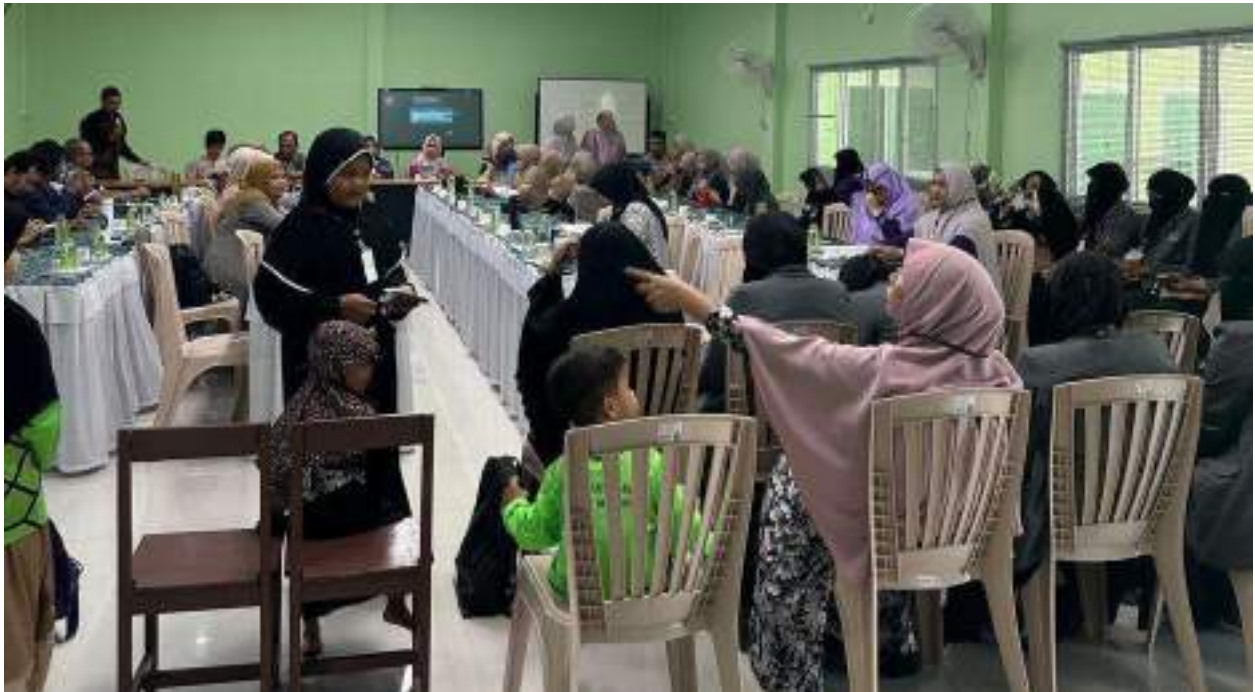
Gambar 9. Peserta Pengabdian Kepada Masyarakat (PKM) Internasional