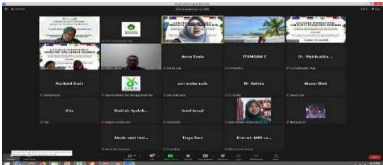
Gambar 1. Kegiatan dilaksanakan secara Hybrid

Pelaksanaan kegiatan dilaksanakan juga dilaksanakan secara Hybrid. melalui link : https://us06web.zoom.us/j/81908194887?pwd=vurmDyBGbzm6d0GTw59nyTBaEe0f6Q.1