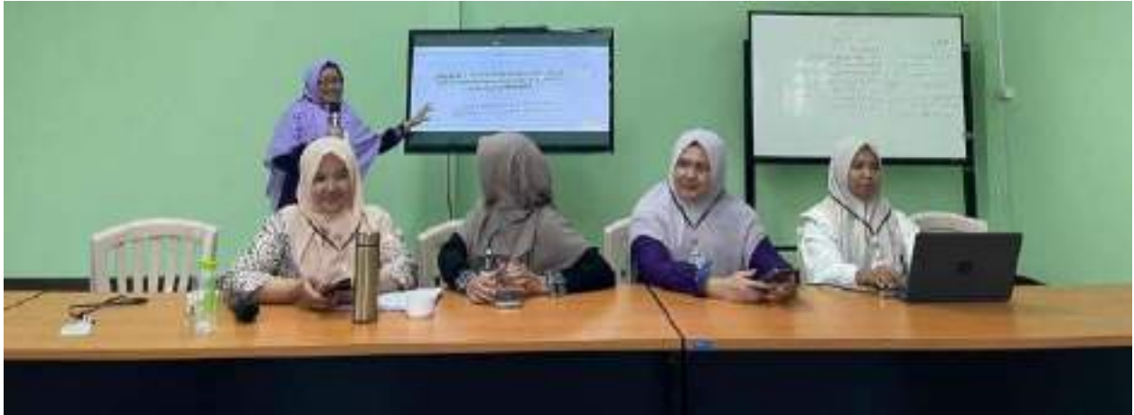
Gambar 8. Pemateri