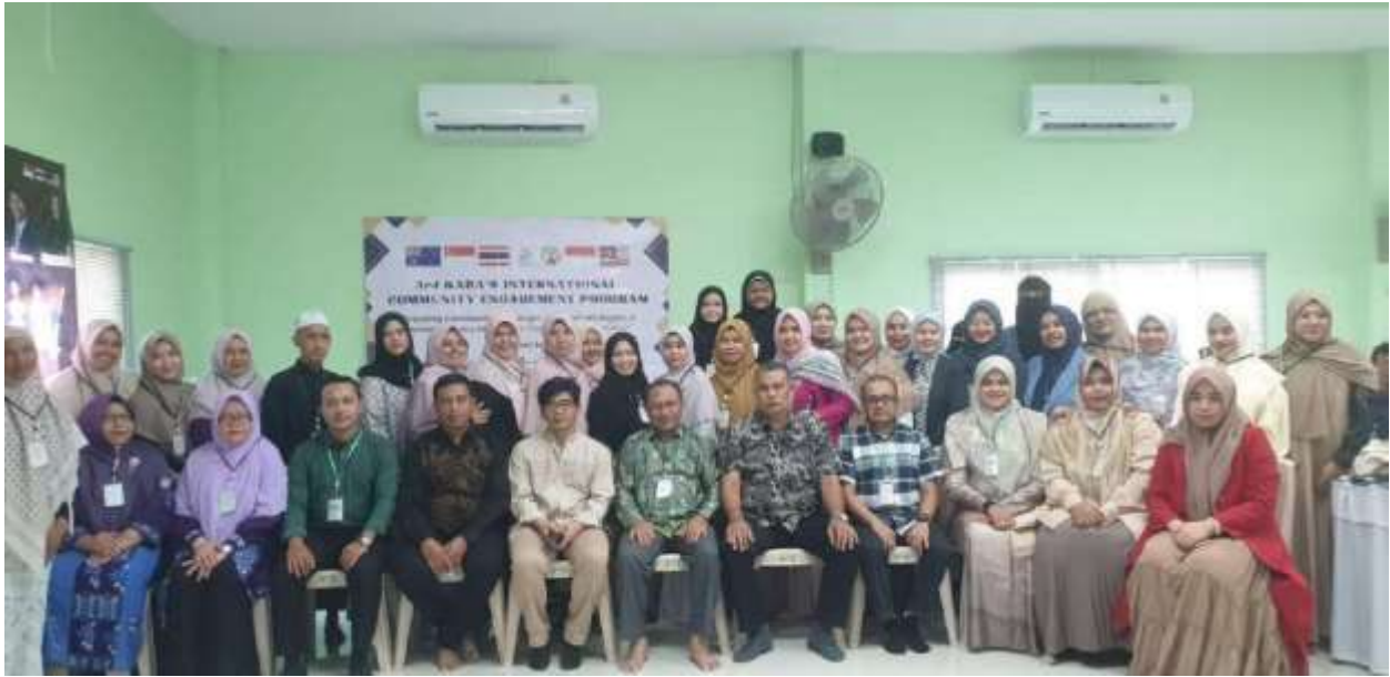
Gambar 10. Foto bersama