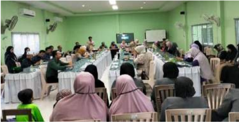
Gambar 3. Sambutan Ketua Al-Hidayah Waqaf Foundation for Education for Social Development