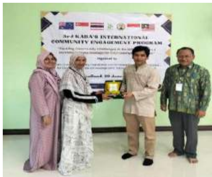
Gambar 6. Penyerahan Plakat