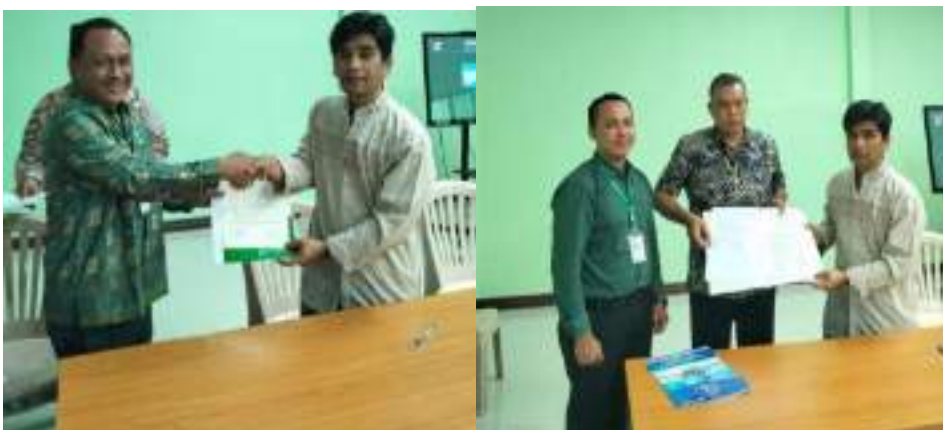
Gambar 4. Penandatanganan Mou dan Moa

Pada kesempatan itu juga ditanda-tangani MoU dan MoA Antara Yayasan KABA, STIES Banda Aceh, Fakultas Kesehatan Masyarakat Universitas Teuku Umar, Universitas Al-Wasliyah Aceh Darussalam, Institut Agama Islam Negeri (IAIN) Takengon, Universitas Muhammadiyah Mahakarya Aceh, Universitas Al-Muslim, Politeknik Kesehatan Kemenkes Aceh, Universitas Syiah Kuala, Universitas Muhammadiyah Luwuk dan Sekolah Tinggi Agama Islam Al-Washliyah Banda Aceh dengan Al-Hidayah Foundation for Educational and social Development. Kerjasama ini melingkupi bidang pengabdian masyarakat, penelitian, pertukaran mahasiswa dan pendidikan secara umum.