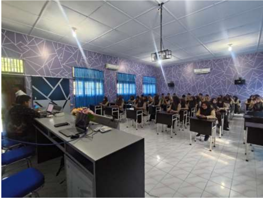
Gambar 1. Foto Sesi Persiapan