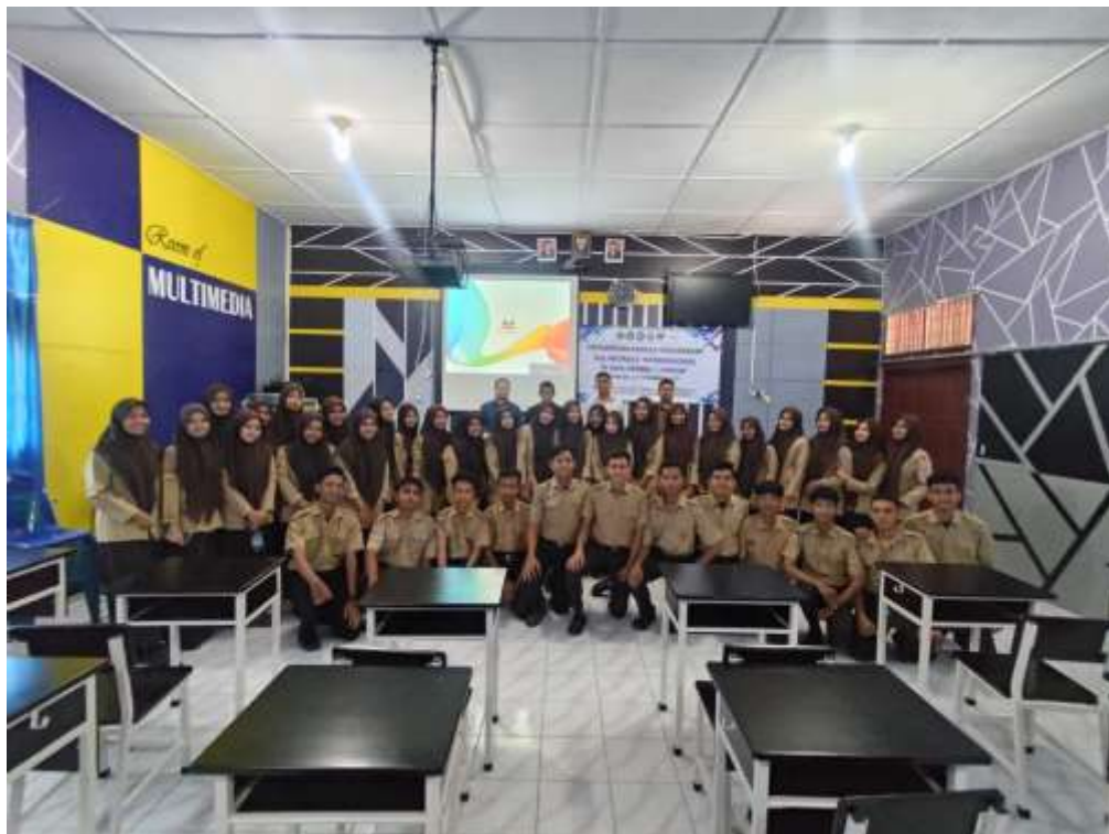
Gambar 4. Foto Bersama dengan Peserta