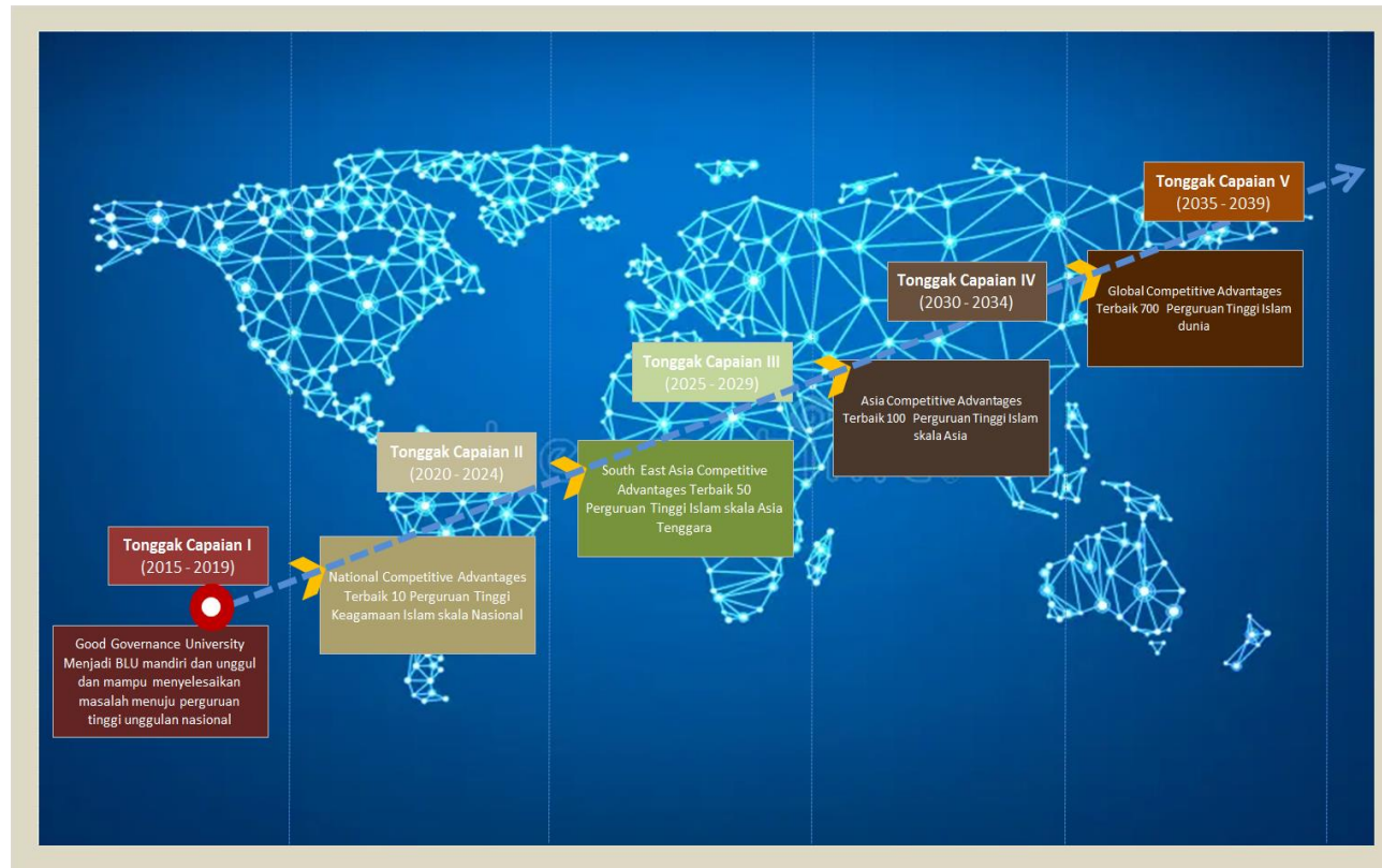
Gambar 1...: Tahapan (milestone) Rencana Program Pengembangan Jangka Panjang (2015-2039) UINAR