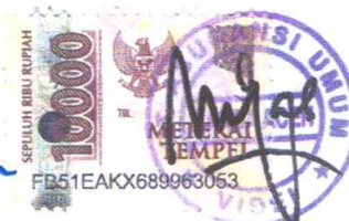
MULYADI NURDIN Kepala Cabang